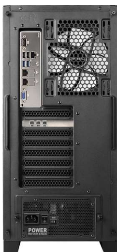
リア (NVIDIA T-200)