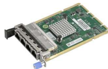
OCP3.0 AIOM LAN カード

PCIe5.0 [X16]バスで CPU に直結される OCP3.0 AIOM LAN カードには、 L2 :Intel i350-AM2 2xGbE (RJ45), L4 :Intel i350-AM4 4xGbE (RJ45), T2 : Intel X710-AT2 2x10GbE (RJ45), T2S2 :Intel X710-TM4 4x10GbE (2x RJ45 & 2x SFP+), S2 :Intel X710-BM2 2x10G (SFP+), S4 :Intel X710-BM1 4x10GbE (SFP+), Q1 :BCM BCM57414 2x25GbE (SFP28), Q2 :Mellanox ConnectX-6 LX 2x25GbE (SFP28), E1 :BCM BCM57508 2x100GbE (QSFP28) の 9 機種が用意されており、2 枚までのカードが実装可能で、仮想化 OS VMWare® ESXi 7.0u3d に対応しています。 (4)